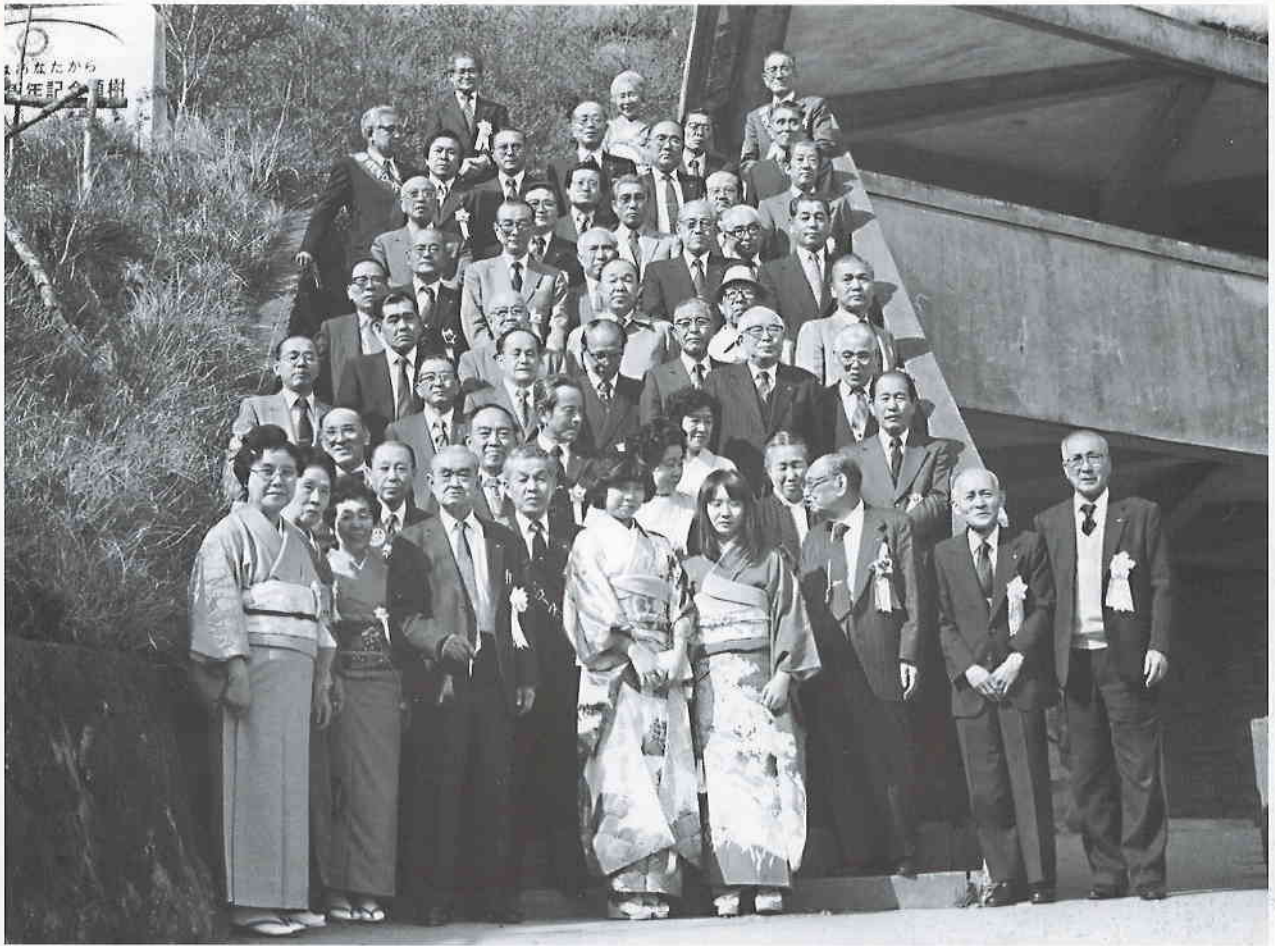
20周年記念式典終了後バスにて山紅葉現場視察