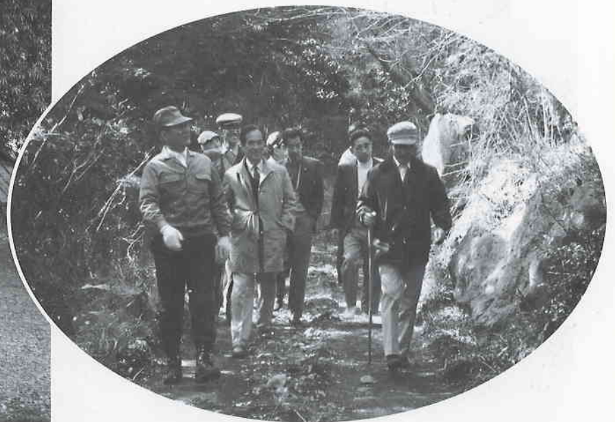
創立12～13年位 下草刈り後ハイキング