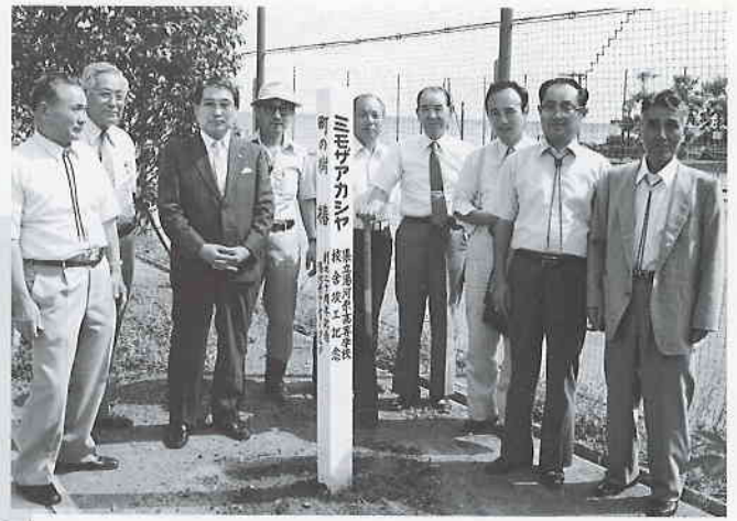
20周年記念行事 ミモザアカシアの植栽 (湯河原高校)