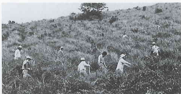
炎天のもと下草刈